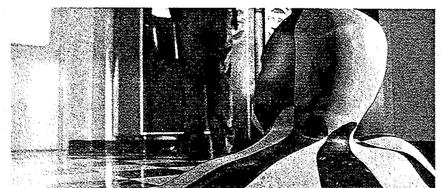
Terminator II TM & © 1991 Carolco International N. V.