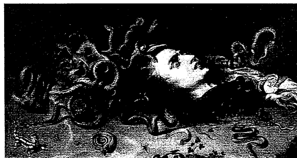
Haupt der Medusa Peter Paul Rubens 1617-18