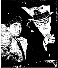
Anna und Sigmund Freud auf ihrem Weg ins Exil, 1938