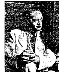
Jakob Levy Moreno