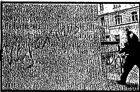
Zum Beispiel: Wien-Leopoldstadt, Hollandstraße.

Lieber wegschauen, bitt' schön, man kann sich ja nicht um alles kümmern,